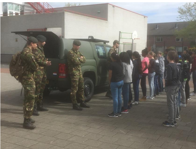
Groetjes, groep 8B

We hebben op 9 mei 2017 een bezoek gehad van de landmacht. We hadden 4 mensen die bij de landmacht werken in de klas er was een sergeant een chauffeur en een schutter en tot slot een pionier. De mensen reden in het pantserwagen genaamd CV-90. Ze hielden een presentatie over het beroep dat ze doen. Ze vertelden dat er verschillende militaire diensten zijn zoals: de landmacht, de luchtmacht, de marine en de marechaussee. Het was heel leerzaam en leuk. We mochten buiten ook zelf iets doen. We werden in drie groepen ingedeeld. Groep nummer 1 ging als eerst sporten omdat je fit moet zijn wil je bij de landmacht komen, daarna gingen we naar een militair die uitleg gaf over wat ze eten als ze uitgezonden werden. Ook mochten we in de auto kijken. Toen ging de groep naar uitleg over de uitrusting van de landmacht. En dat mochten we ook aan. Dit allemaal bij elkaar maakte voor ons een super leuke ochtend.